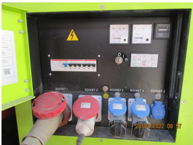
Generator fra Entreprenør Egelund A/S